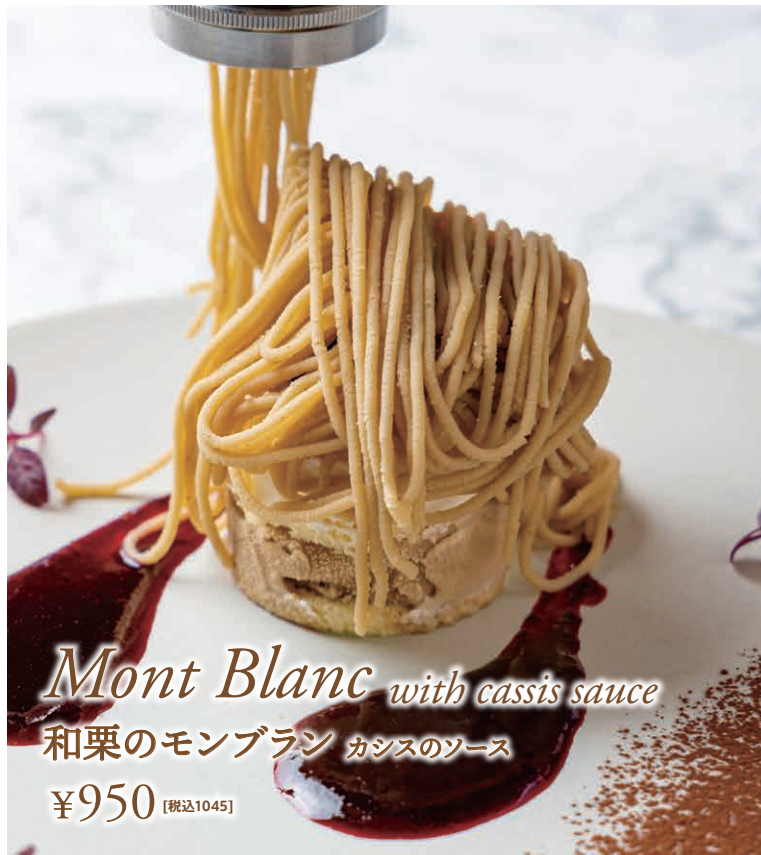
Mont Blanc with cassis sauce