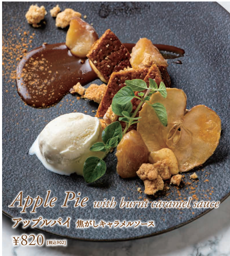
Apple Pie with burnt caramel sauce