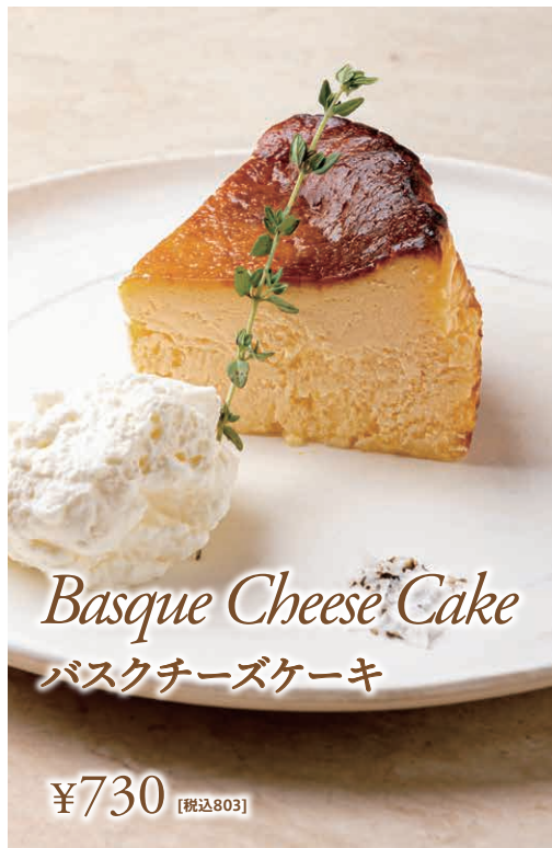
Basque Cheese Cake