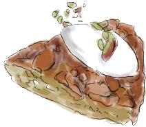
CARAMEL NUTS TARTE キャラメルナッツ・タルト 750 [税込825]