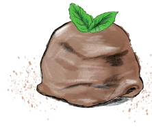
HOMEMADE CHOCOLATE ICE CREAM 自家製チョコレートアイス 630 [税込693]