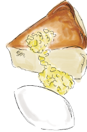
BASQUE STYLE CHEESE CAKE WITH LEMON SAUCE バスクチーズケーキ しまなみレモンソース 750 [税込825]