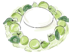
MELON & KIWI PANNA COTTA メロンとキウイのパンナコッタ 800 [税込880]