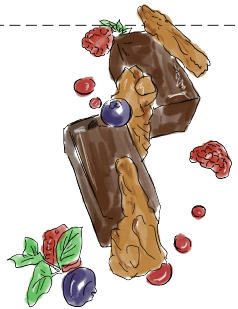
VEGAN CHOCOLATE CAKE ヴィーガン・チョコレートケーキ フランボワーズソース 800 [税込880]