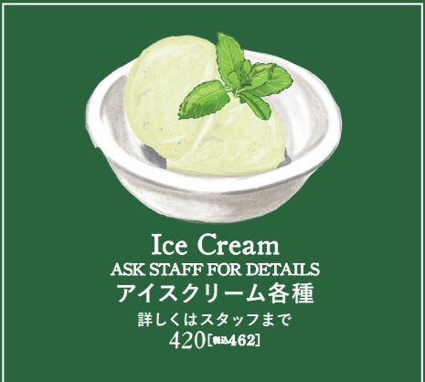
Ice Cream ASK STAFF FOR DETAILS アイスクリーム各種 詳しくはスタッフまで 420 【税込462】