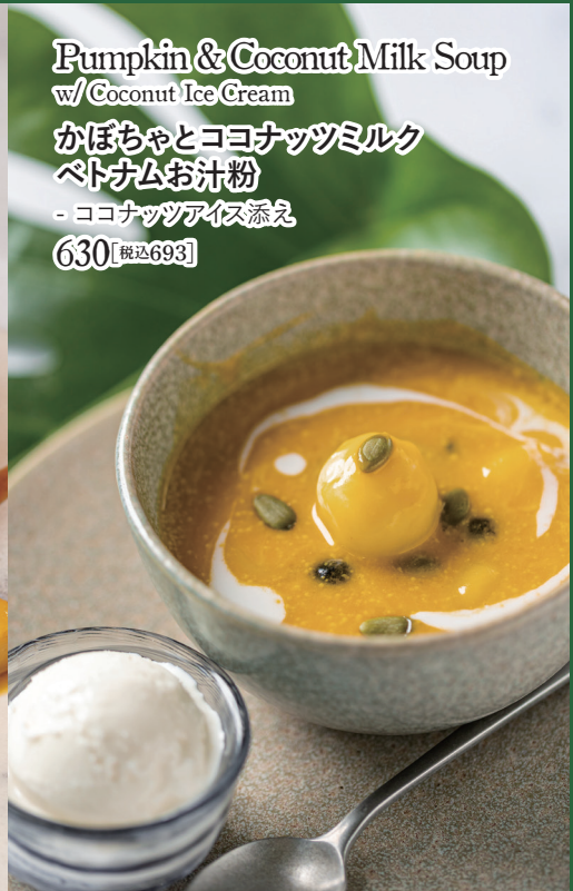
Pumpkin & Coconut Milk Soup w/ Coconut Ice Cream かぼちゃとココナッツミルク ベトナムお汁粉 - ココナッツアイス添え 630 【税込693】