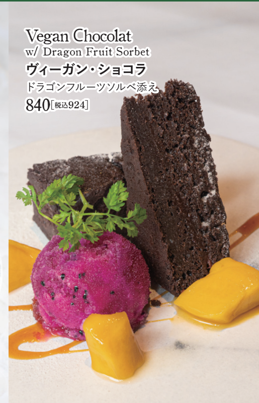
Vegan Chocolat w/ Dragon Fruit Sorbet ヴィーガン・ショコラ ドラゴンフルーツソルベ添え 840 【税込924】