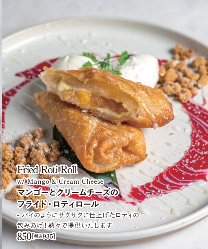
Fried Roti Roll w/ Mango & Cream Cheese マンゴーとクリームチーズの フライド・ロティロール - パイのようにサクサクに仕上げたロティの 包みあげ! 熱々で提供いたします 850 【税込935】