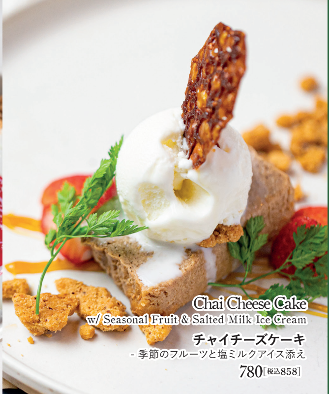
Chai Cheese Cake w/ Seasonal Fruit & Salted Milk Ice Cream チャイチーズケーキ - 季節のフルーツと塩ミルクアイス添え 780 【税込858】