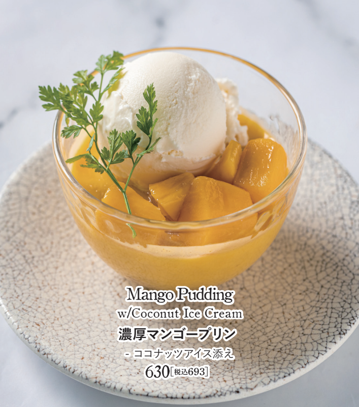
Mango Pudding w/Coconut Ice Cream 濃厚マンゴープリン - ココナッツアイス添え 630 【税込693】