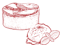
Tarte Tatin FRENCH STYLE APPLE TARTE タルト・タタン