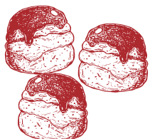
Profiteroles CREAM PUFF プロフィットロール HUGE65のショコラソース