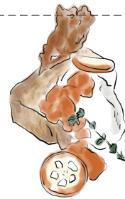
CHAI CHEESE CAKE WITH KUMQUAT SAUCE チャイチーズケーキ 金柑ソース 680 [税込748]