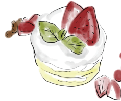
STRAWBERRY SHORT CAKE 苺のショートケーキ 890 [税込979]