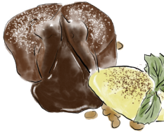
COFFEE FONDANT CHOCOLATE コーヒー・フォンダンショコラ 780 [税込858]