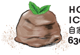
HOMEMADE CHOCOLATE ICE CREAM 自家製チョコレートアイス 630 [税込693]