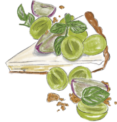
SHINE MUSCAT & PIONE TARTE シャインマスカットとピオーネのタルト 800 [税込880]