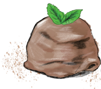
HOMEMADE CHOCOLATE ICE CREAM 自家製チョコレートアイス 600 [税込660]