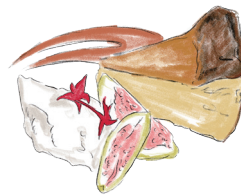
BASQUE STYLE CHEESE CAKE WITH FIG 無花果のバスクチーズケーキ 650 [税込715]