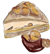
MONT BLANC WITH CASSIS SAUCE 和栗のモンブラン カシスソース 850 [税込935]