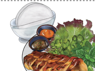
ライスペーパーで巻く甘草とスパイスに焼いた 豚肉と山盛りハーブ ローストポークハノイスタイル Spicy Roast Pork