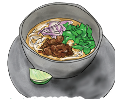
自家製彩菜鶏ハムの ベトナム汁そば [フォー・ガー] PHO GA Chicken Pho