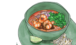
トムヤムヌードル TOM-YAM NOODLE