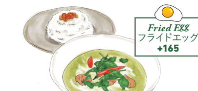
鶏肉と茄子のグリーンカレー GREEN CURRY with Chicken and Eggplant