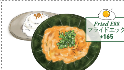
プーパッポンカレー 蟹のふわふわ卵カレー POO PAD PONG CURRY Mixed Crabs And Egg