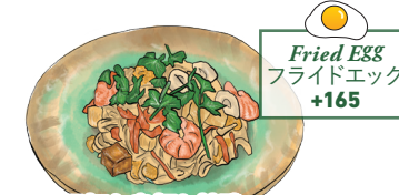
もちり平打ち米麺と甘酸っぱいソースの タイ焼きそば パッタイ PAD THAI Thai Style Stri Fried Noodle