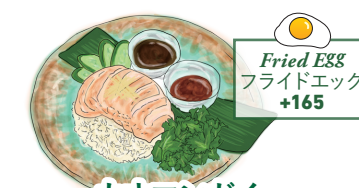
カオマンガイ 柔らか蒸し鶏のチキンライス KHAO MAN KAI Hainanese Chicken Rice