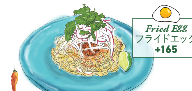
香味野菜とトムヤムスパイス・豚肉の 汁なし中華あえ麺 [バミー・ヘーン] BAH MEE HAENG Tossed Pork Noodle