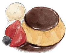
CRÈME CARAMEL 950 french egg pudding クレーム・キャラメル [税込 1045]