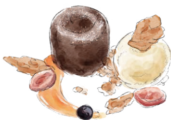
FONDANT AU CHOCOLAT 1100 chocolate fondant フォンダン・ショコラ [税込 1210]