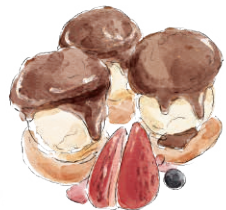
PROFITEROLES 900 cream puff プロフィットロール HUGE65のショコラソース [税込 990]