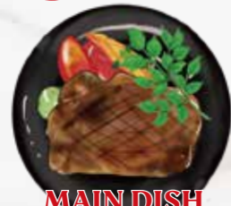
MAIN DISH 選べる メインディッシュ