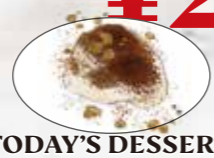
TODAY'S DESSERT 本日のミニデザート ※プラス¥500でアラカルトメニューより お好きなデザートをお選びいただけます。