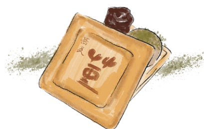
BLACK BEANS & ICE CREAM SANDWICH "MONAKA"