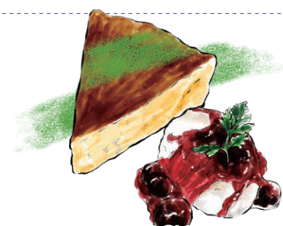
BASQUE BURNT CHEESE CAKE