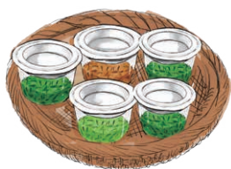
JAPANESE TEA SELECTION