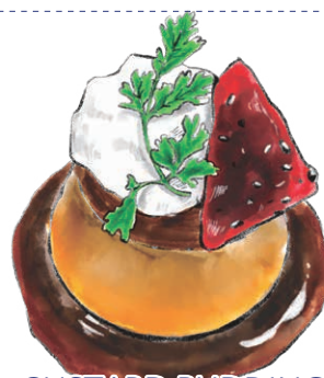
CUSTARD PUDDING 那須御養卵のプリン [ぶっちゃんして召し上がれ]