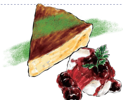
BASQUE BURNT CHEESE CAKE with cassis berry sauce バスクチーズケーキ カシスベリーソース