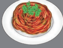
PASTA WITH A SIDE SALAD サラダ [サラダ付き]