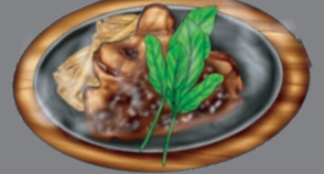
BUTCHER AND JOSPER GRILL WITH A SIDE SALAD ブッチャー&ジョスパーグリル [サラダ・パン または ライス付き]