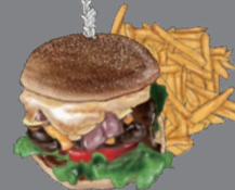
BURGER WITH A SIDE SALAD バーガー [サラダ付き]