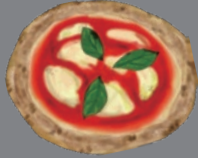
PIZZA WITH A SIDE SALAD ピッツァ [サラダ付き]

CATEGORIES ON THE RIGHT ITEMS FROM A LA CARTE MENU SERVED WITH A SIDE SALAD DURING LUNCH HOURS.