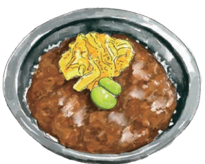
Minced Wagyu Don 有田牛のそぼろご飯

小井 "KODON" Mini Rice Bowl 各種 ¥600 [税込660]