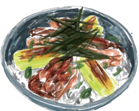
Yakitori Don 清流鶏の焼き鳥丼