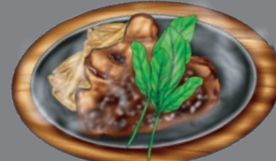
BUTCHER AND JOSPER GRILL WITH A SIDE SALAD ブッチャー&ジョスパーグリル [サラダ・パン または ライス付き]