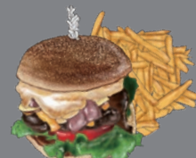
BURGER WITH A SIDE SALAD バーガー [サラダ付き]