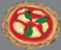
PIZZA WITH A SIDE SALAD ピッツァ [サラダ付き]

CATEGORIES ON THE RIGHT ITEMS FROM A LA CARTE MENU SERVED WITH A SIDE SALAD DURING LUNCH HOURS.